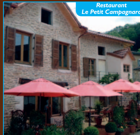
Restaurant Le Petit Campagnard