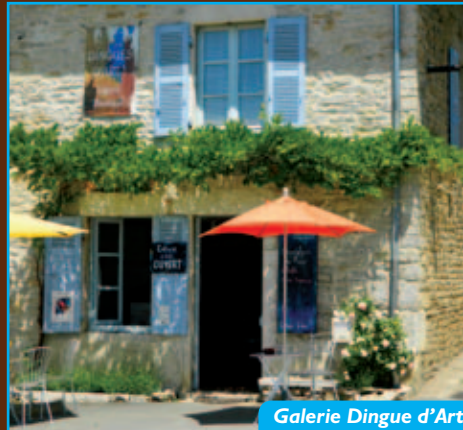
Galerie Dingue d'Art