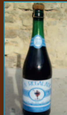
Vigneron La Combe aux Rêves