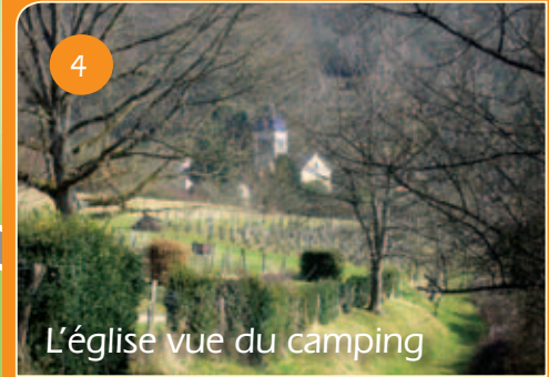
4 L'église vue du camping