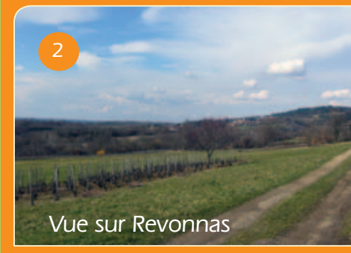
2 Vue sur Revonnas