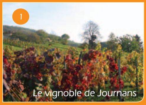
1 Le vignoble de Journans