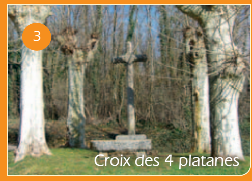
3 Croix des 4 platanes