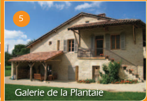
5 Galerie de la Plantaie