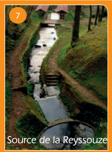
7 Source de la Reyssouze